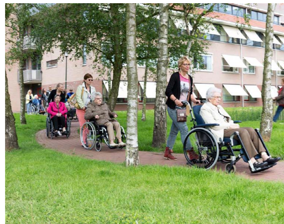
Archiefphoto KW Doet 2016

Voor projecten of activiteiten in de gemeenten Alkmaar en Castricum kunnen wij nog wel ideeën gebruiken. Heeft u een interessant project, initiatief of activiteit in Alkmaar of Castricum waar wij aan kunnen bijdragen op deze dag in het voorjaar? Laat het ons weten! Denk bijvoorbeeld aan: kleine klusjes in en om het huis, tuinonderhoud, uitleg over het Mijn Kennemer Wonen account, een wandeling maken, kopje koffie drinken etc. Stuur uw idee naar info@kennemerwonen.nl . Alle ideeën zijn welkom!