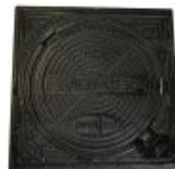
PK 315 mm erfafscheidingsputje