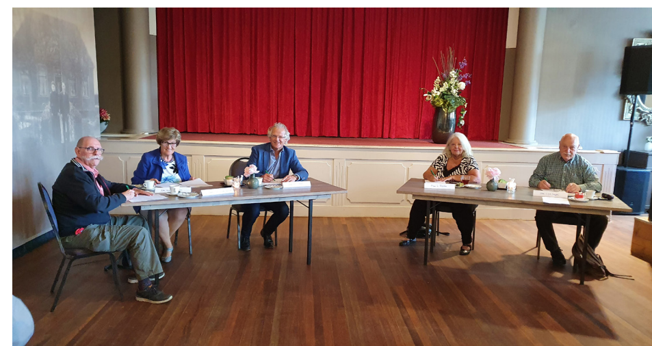
Ondertekening van de samenwerkingsovereenkomst, op gepaste afstand.

Met deze vorm van samenwerking en de oprichting van een Centrale Huurderskoepel, is de participatie van huurders gewaarborgd en wordt de verbinding met huurders nog verder versterkt. Via periodiek overleg met de Centrale Huurderskoepel wordt gesproken over allerlei onderwerpen die betrekking hebben op alle huurders van Kennemer Wonen. De Centrale Huurderskoepel heeft informatie-, advies-, instemmingsrecht over een groot aantal onderwerpen. Daarnaast praat zij mee over het opstellen van de prestatieafspraken die met gemeentes worden gemaakt. De ondertekening van deze samenwerkingsovereenkomst biedt een mooie basis voor een nog betere samenwerking met onze huurdersvertegenwoordigers. Want tevreden huurders, daar zetten wij ons hard voor in!