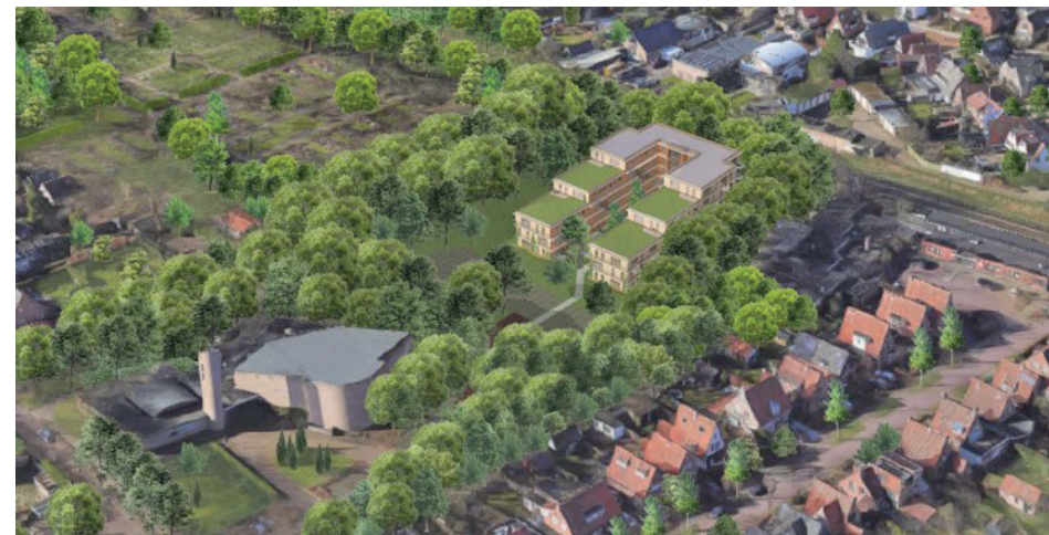
Impressie van het nieuwbouwplan aan de Ter Coulsterlaan

Het ontwerp is een initiatief van Kennemer Wonen. Wij denken dat we in totaal circa 50 betaalbare huurwoningen kunnen realiseren op deze locatie in Heiloo. Dat is goed nieuws voor de woningzoekenden. De exacte plaats en omvang van de nieuwbouw staat nog niet vast. Bij de verdere uitwerking van de plannen proberen wij de ingreep voor natuur en bomen zoveel mogelijk te beperken. Wij verwachten daarover in de loop van dit najaar contact met de bewoners en de omwonenden te hebben. Het plan moet ook nog worden behandeld door de gemeenteraad.